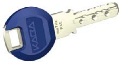
Ключ KABA maTrix SmartKey