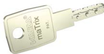
Ключ KABA maTrix Lange Reide